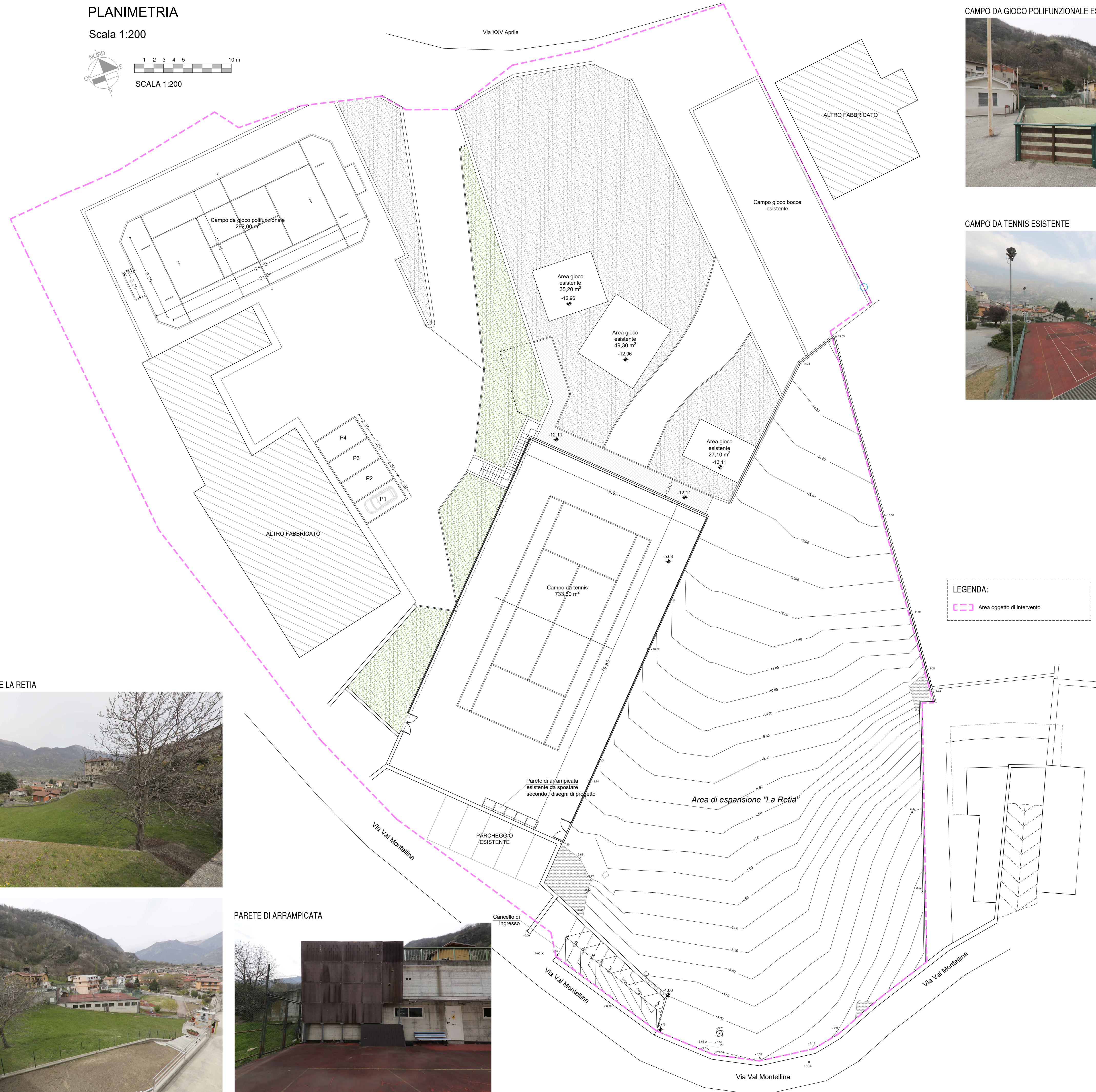
A photograph of a modern building with a large, dark, textured facade made of vertical panels. To the right, a concrete structure with a balcony and a blue bench is visible. The foreground is a reddish-brown paved area.